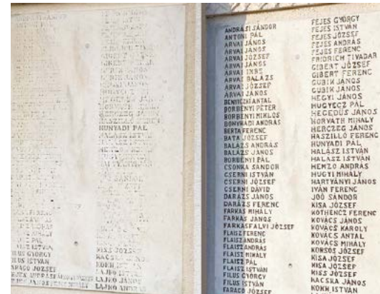
Felújítás előtt és után