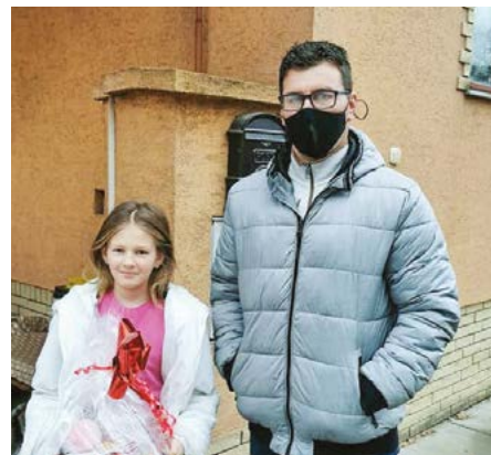
A nyeremény átadása a két kategória első helyezettjének