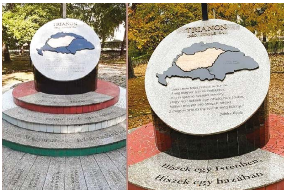
Felújítás előtt és után

Egyesületünk kezdeményezésére a II. világháborús emlékmű neveinek újrafestésével egy időben egy másik emlékhely is megújult városunkban.