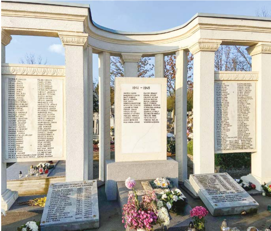
A felújított emlékmű