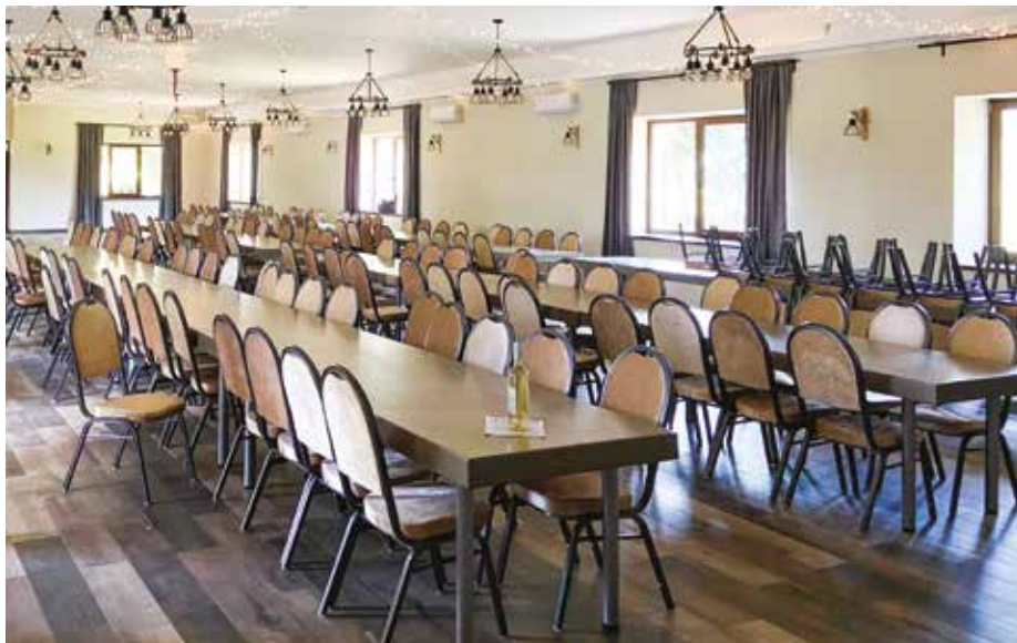
A rendezvényterem belülről

A mostani időszak próba év, a végleges arculat kialakításához a tapasztalatok gyűjtése. Folyamatban van a pince felújítása, amely a későbbiekben borhoz, pálinkához kapcsolódó rendezvények helyszíne is lehet. Továbbá a lovas kultúrát egy tárlat kereteiben szeretnénk bemutatni, valamint veterán motorokból álló gyűjteményünket az érdeklődők előtt megnyitni. A működés feltétele a segítők, alkalmazottak munkája, tehát nemcsak a szabadidő eltöltésének lehetőségét, hanem munkalehetőséget is kínál dolgozó emberek számára.