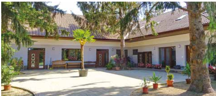
A rendezvényterem és a 40 fős szállás kívülről